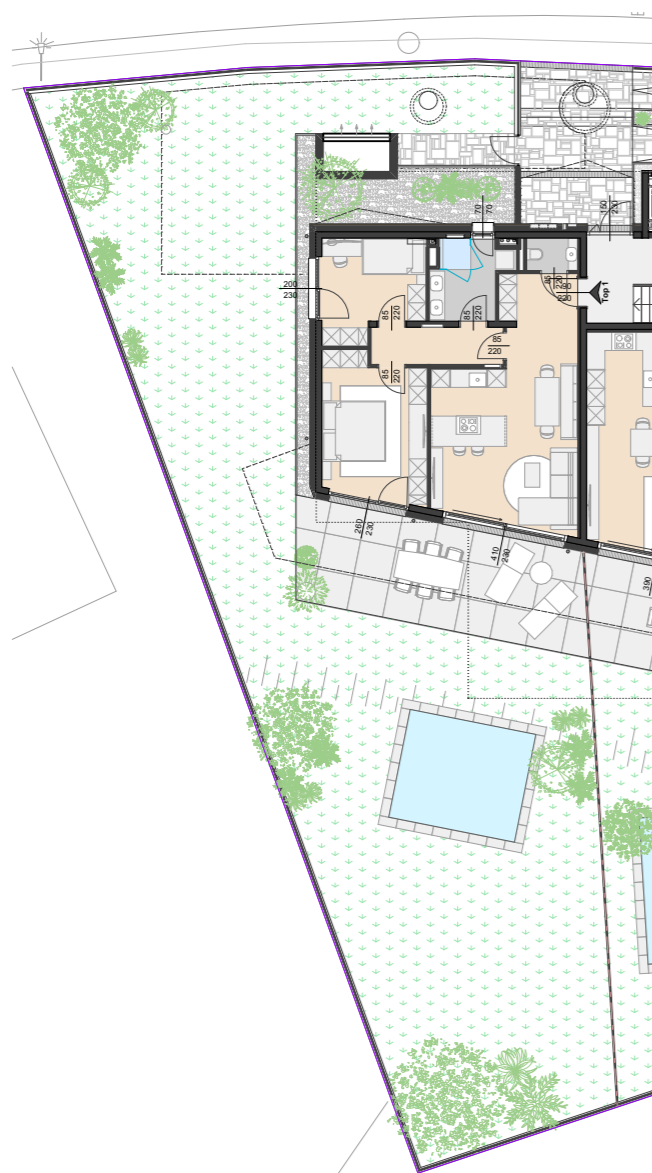
GRUNDRISS M= 1:250