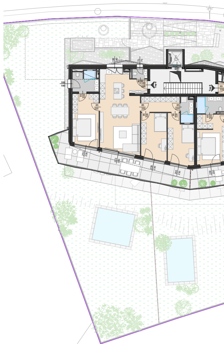
GRUNDRISS M= 1:250